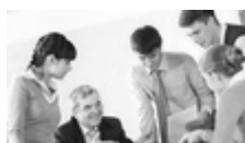
Ledelse på tværs