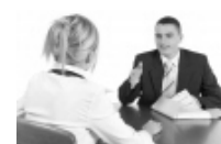
Ledelse opad til